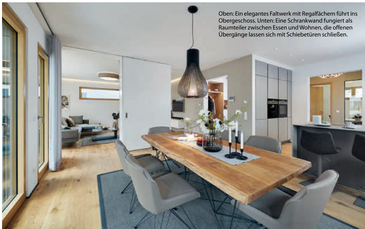
Oben: Ein elegantes Falwerk mit Regalfächern führt ins Obergeschoss. Unten: Eine Schrankwand fungiert als Raumteiler zwischen Essen und Wohnen, die offenen Übergänge lassen sich mit Schiebetüren schließen.